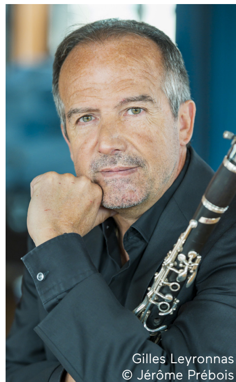
Gilles Leyronnas